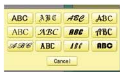
12 fontes/6 tamanhos