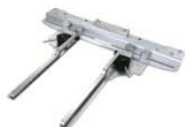
Prendedor de bolsa.