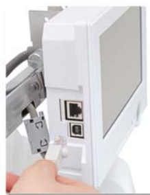
Conexão USB e Rede