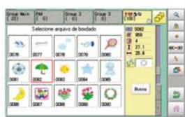
Administra diretórios de forma gráfica.