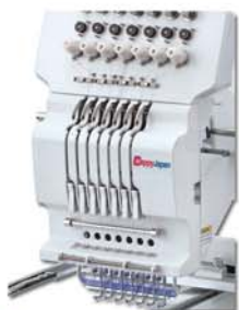
Passagem de linha simplificada