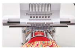
Bastidor "one point".