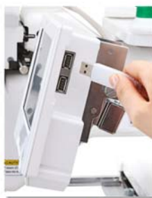
Pendrive e Mouse