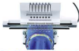
Bastidor de bonés amplo.