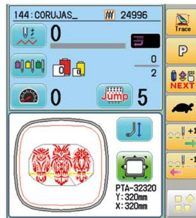
Comandos a um toque de distância.