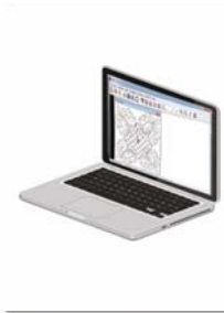
Softwares Happy Link e Happy LAN