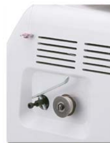
Enchedor de bobina incorporado