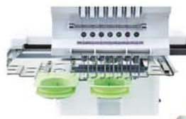
Bastidor de meias.