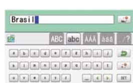
Teclado virtual facilita digitação.