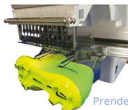
Prendedor para calçados.