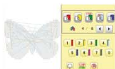
Paradas e corta fio com fácil programação.